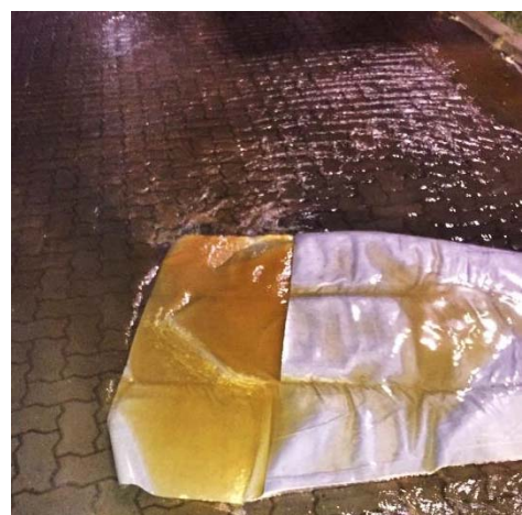
Abbildung 4: Trübung an der Ausspeisestelle während der Reinigung