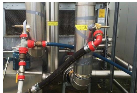
Abbildung 3: Einspeisung (l.) und Ausspeisung (r.) über Adapteranschlüsse