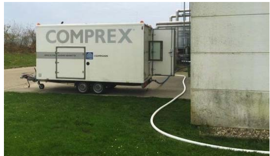
Abbildung 1: Comprex®-Einheit im Einsatz vor Ort