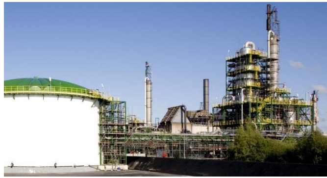
Abbildung 1: Biogasanlage mit Gasaufbereitung [1]