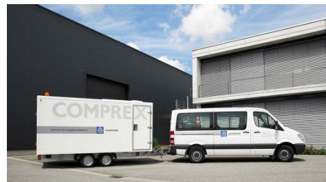
Abbildung 2: Complex ® -Einheit vor Ort