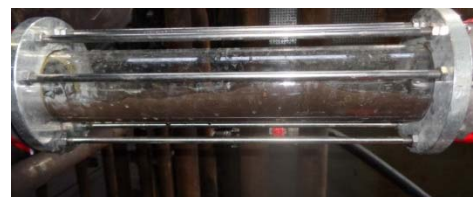
Abbildung 4: Trübung in Schauglas