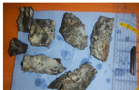
Abbildung 5: aus dem System entfernte Verkrustungen