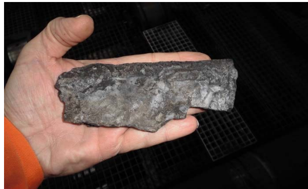
Abbildung 1: Verkrustungen im Detail