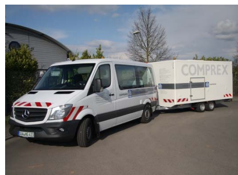
Abbildung 1: Complex ® -Einheit zur Bereitstellung von Druckluft