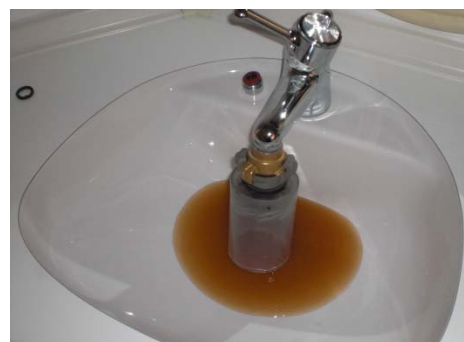
Abbildung 3: Trübung bei Ausspeisung über Waschbecken