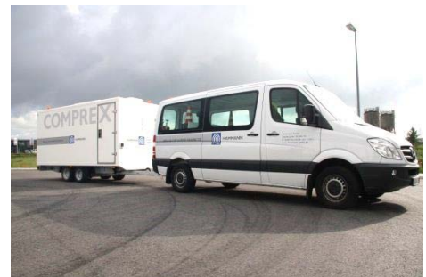
Abbildung 1: Complex ® -Einheit