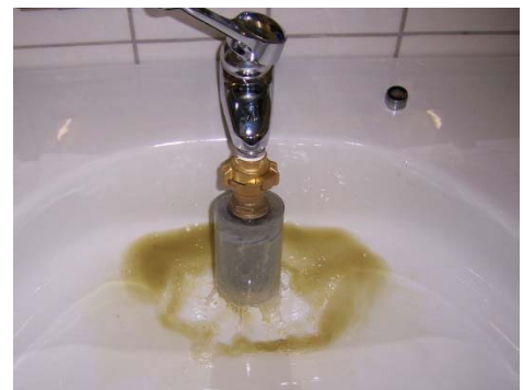
Abbildung 2: Ausspeisung über Waschbecken