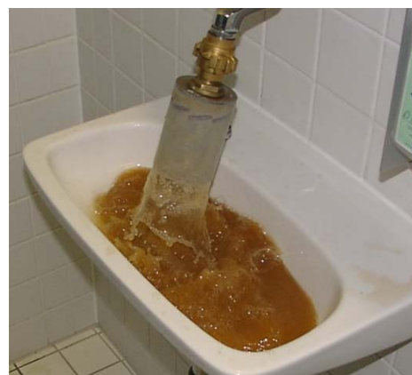
Abbildung 2: Trübung bei Ausspeisung über Waschbecken