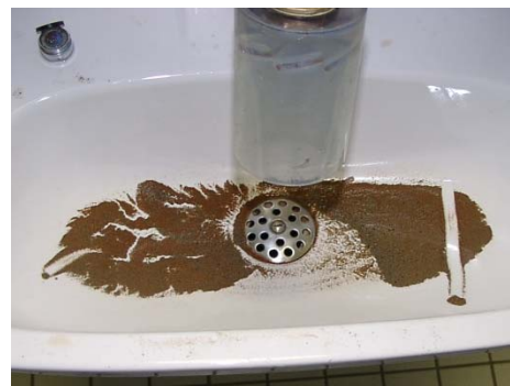
Abbildung 3: aus der Trinkwasser-Installation entfernte Partikel an Zapfstelle