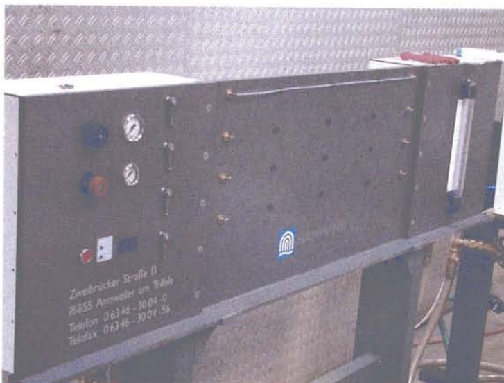
Abbildung 2: Teststand zur Reinigung von Endoskopschläuchen mittels Complex-Verfahren.

Zur Reinigung wurden diese Schläuche bei geringem Wasserdruck