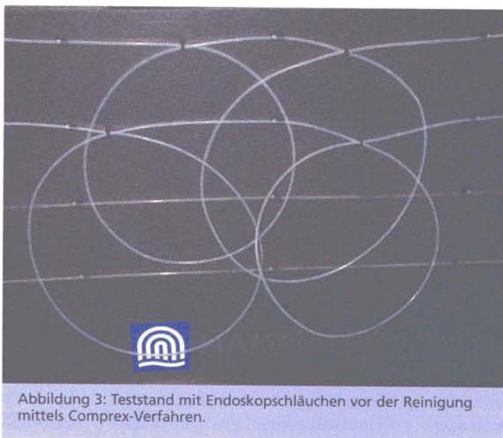
Abbildung 3: Teststand mit Endoskopschläuchen vor der Reinigung mittels Complex-Verfahren.

und Volumenstrom mit Luftimpulsen von unterschiedlicher Frequenz beaufschlagt.