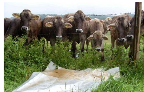
Abbildung 3: Ausspeisestelle