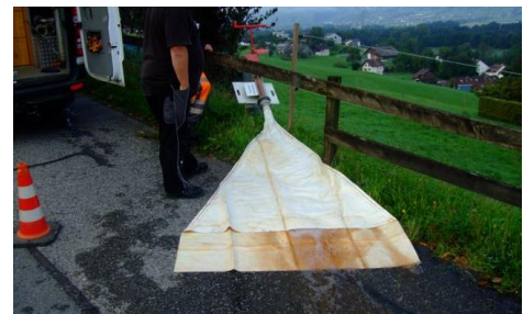
Abbildung 2: Spülsack an Ausspeisestelle