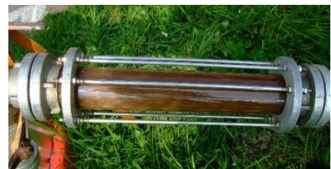
Abbildung 4: Schauglas während der Reinigung