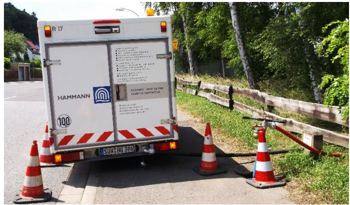
Abbildung 1: Comprex®-Technik im Einsatz