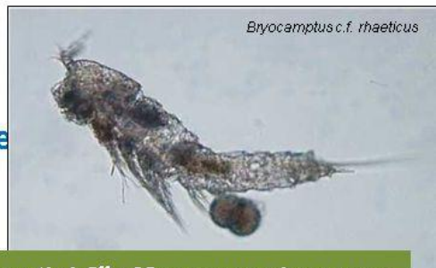
Abbildung 2: Bei der Grundwasserneubildung treten steile Gradienten, u. a. bei organischem Kohlenstoff (DOC), Sauerstoff und Temperaturamplitude auf. Die Fauna ist an diese Gradienten angepasst.

Grundwassertiere können keine Massenpopulationen aufbauen. Dort, wo Oberflächenformen vorkommen, wird die Grundwasserfauna durch jene sich rasch vermehrenden Arten verdrängt, bzw. sie ertragen die hohen Sommertemperaturen nicht. Ihr Revier sind die gut abgeschirmten Wässer mit schlechtem Nahrungs- und Sauerstoffangebot - echtes Grundwasser, das ihnen ein Rückzugsgebiet vor den Oberflächenarten bietet.