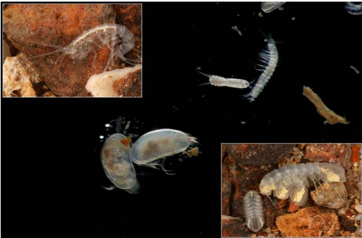
Abbildung 1: Tiere des Grundwassers: Links oben Höhlenflohkrebs, rechts unten eine Grundwasserassel, in der Mitte Muschelkrebs, Raupenhüpferling und Brunnenkrebs (von links unten nach rechts oben). Echte Grundwassertiere sind meist blind, unpigmentiert, langgestreckt und besitzen einen reduzierten Stoffwechsel um knappe Energie zu sparen.

Alle Grundwassertiere zeigen bemerkenswerte Anpassungen an den Lebensraum Grundwasser [1] (Abb. 1).