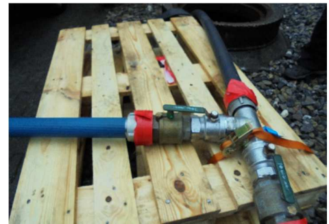
Abbildung 2: zentrale Einspeisung von Luft und Wasser in Schacht