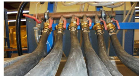
Abbildung 3: Ausspeisung über mehrere parallele Anschlüsse