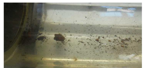
Abbildung 5: ausgetragene Grobpartikel in Schauglas während der Reinigung