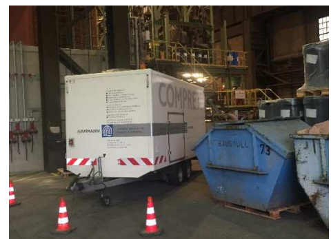
Abbildung 2: Complex®-Einheit im Einsatz