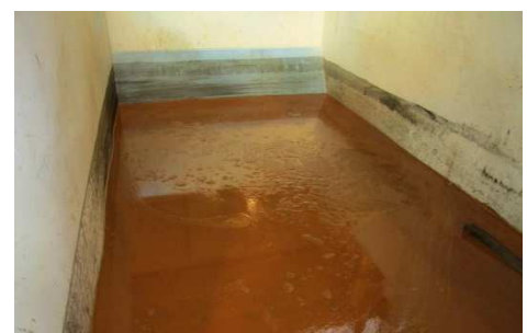
Abbildung 4: Austrag in Auffangbehälter