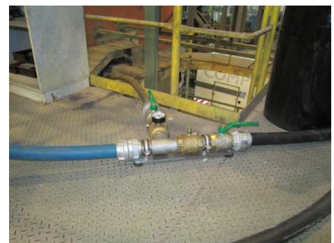
Abbildung 3: Einspeisung von Druckluft und Wasser über Adapteranschlüsse