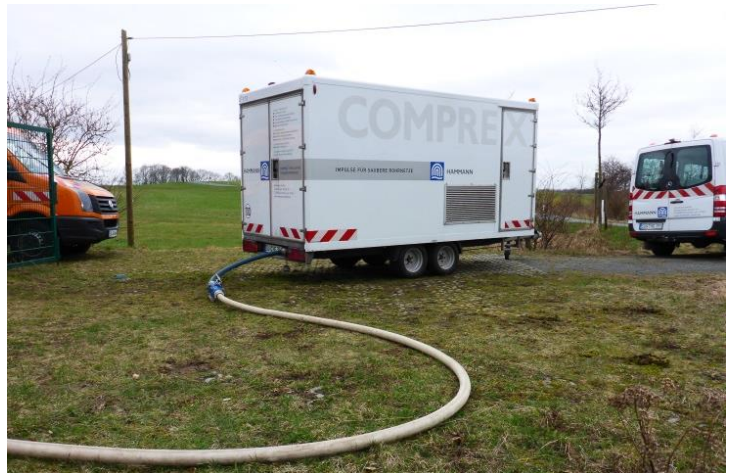
Abbildung 1: Comprex®-Einheit im Einsatz