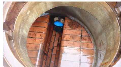
Abbildung 3: Ausspeisestelle in Schacht