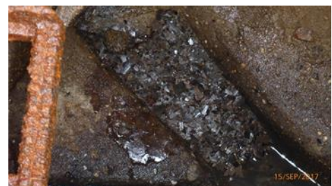
Abbildung 4: Ablagerungen in Schacht