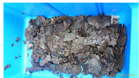
Abbildung 5: ausgetragene Grobpartikel