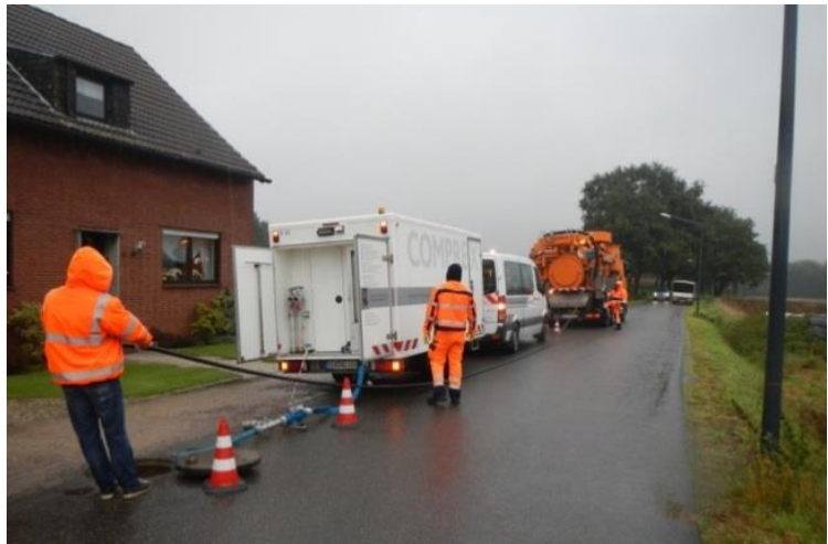
Abbildung 1: Comprex®-Einheit und Spülwagen im Einsatz

Referenzprojekt Abwasserdrucknetz Metropolregion Rhein-Ruhr