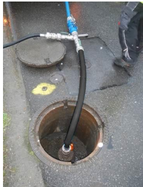
Abbildung 2: Einspeisung komprimierter Luft und Wasser in Zwischenschacht