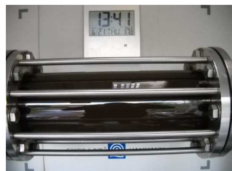
Abbildung 3: Trübung während der WSS