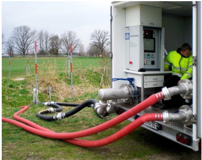
Abbildung 1: ExtraQt® im Einsatz vor Ort