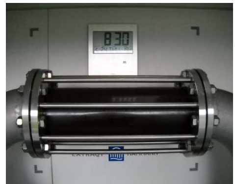
Abbildung 3: Trübung in Schauglas während des ExtraQt®-Prozesses