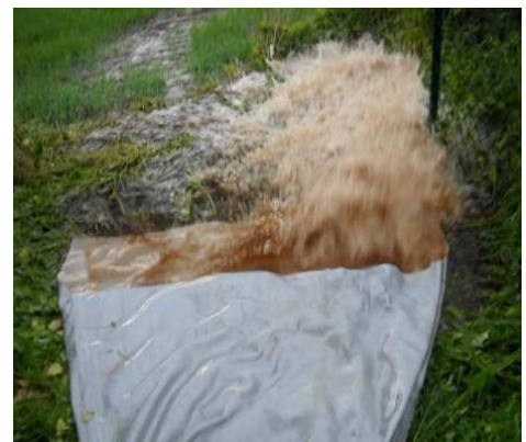
Abbildung 4: Trübung im Spülwasser an der Entnahmestelle