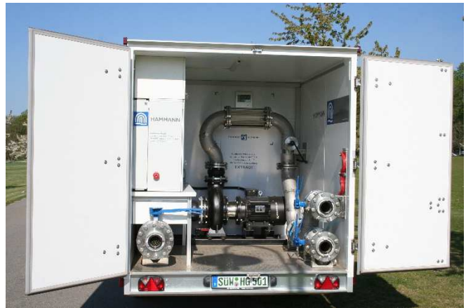
Abbildung 1: Spezialequipment für ExtraQt®