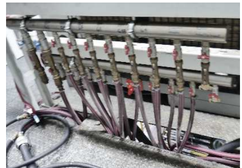
Abbildung 3: Verzweigung auf die neun Kühlkreisläufe