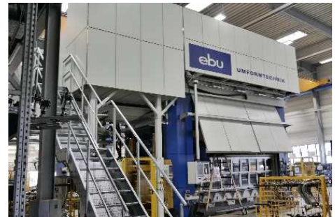
Abbildung 2: Gesamtansicht der Stanzmaschine