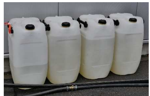
Abbildung 4: Auffangbehälter für das Kältemittel Antifrogen N