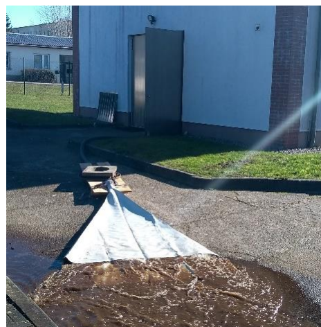
Abbildung 3: Ausspeisung am Wasserwerk