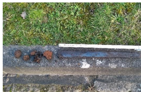
Abbildung 4: Feststoffe als Teil des Austrages