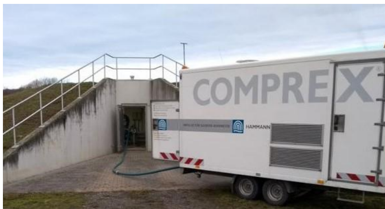
Abbildung 1: Comprex®-Einheit im Einsatz (Symbolbild)

Referenzprojekt Wasserwerk in Mecklenburg- Vorpommern