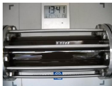
Abbildung 3: Trübung während der WSS