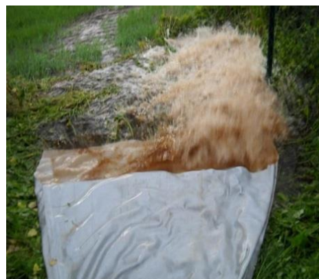
Abbildung 4: Trübung im Spülwasser an der Entnahmestelle