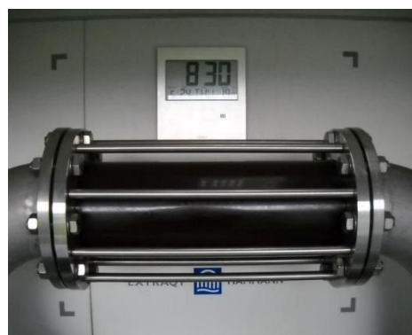
Abbildung 3: Trübung in Schauglas während des ExtraQt®-Prozesses