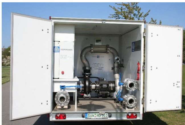
Abbildung 1: Spezialequipment für ExtraQt®