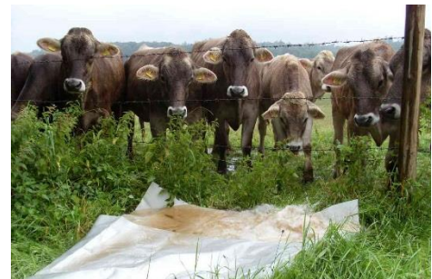
Abbildung 3: Ausspeisestelle mit Fachpublikum