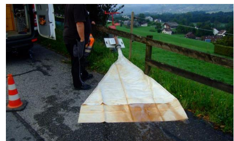
Abbildung 2: Spülsack an Ausspeisestelle