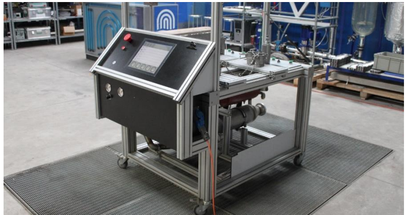
Abb. 1: Flexibler Reinigungsstand für Wärmeübertrager