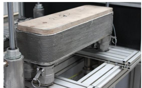
Abb. 2: eingespannter Wärmeübertrager

https://comprex.de/reinigungszentrum-landau/