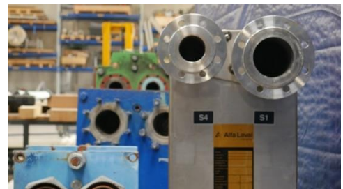
Abb. 3: größere Wärmeübertrager