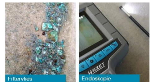
Abb. 4: Schmutzaustrag / Endoskop