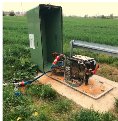
Abbildung 3: Zugang über Adapteranschlüsse