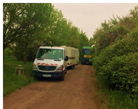
Abbildung 2: Complex®-Einheit vor Ort