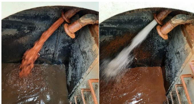
Abbildung 1: Trübung vor und nach der Reinigung