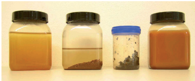
Bild 4 Austräge aus Trinkwasserinstallationen in Gebäuden

Das Impuls-Spül-Verfahren Complex wurde inzwischen weiterentwickelt. Die Luftimpulse und die Impulssequenzen werden nun computergesteuert moduliert und an die jeweilige Rohrcharakteristik optimal angepasst. Auf diese Verbesserungen wurde der Hammann GmbH im Sommer 2014 ein Patent erteilt. Dadurch änderte sich auch der Verfahrensname von „Impuls-Spül-Verfahren Complex“ zu „patentiertes Complex-Verfahren“.