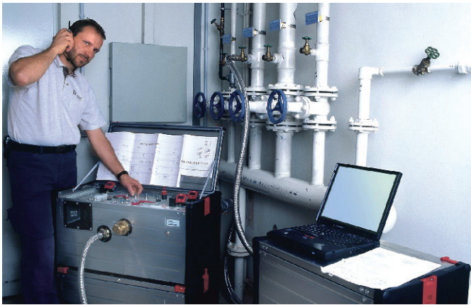
Bild 2 Anschluss der Impuls-Spülbox an eine Steigleitung

mann GmbH ein mechanisches Reinigungsverfahren zur Verfügung, welches eine außerordentlich hohe Reinigungsleistung auch bei sehr großen Nennweiten (bis DN 1200) aufweist. Es wird seit 2005 auch in der Hausinstallation eingesetzt (Bild 2).