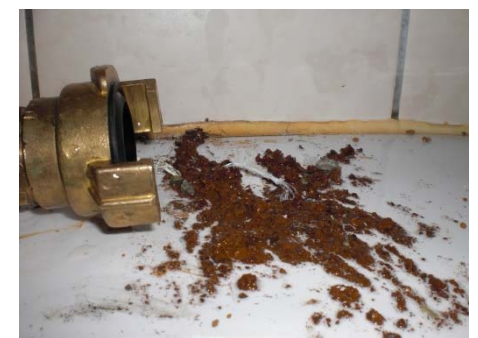
Abbildung 3: aus dem System entfernte Korrosionsprodukte