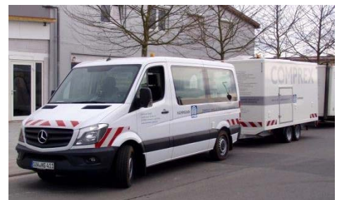
Abbildung 1: Complex ® -Einheit zur Bereitstellung von Druckluft