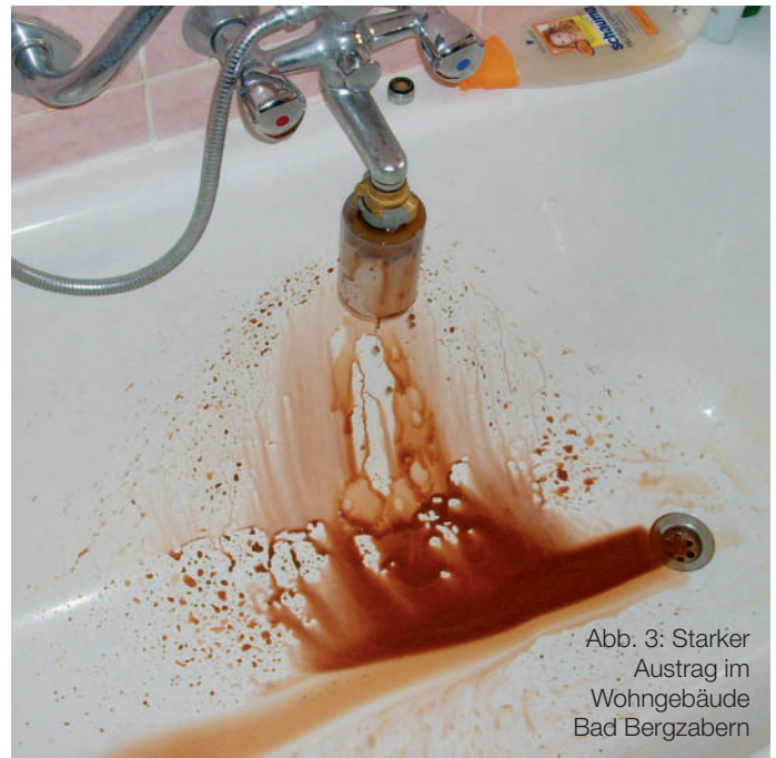
Abb. 3: Starker Ausstrag im Wohngebäude Bad Bergzabern