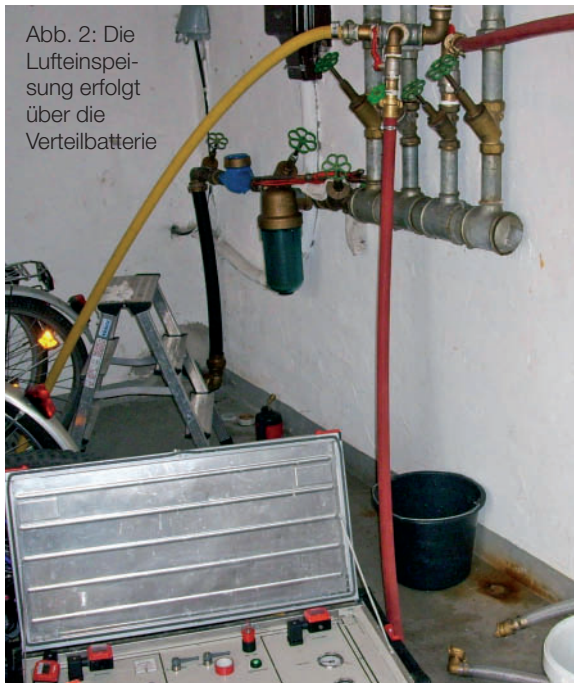
Abb. 2: Die Luftspeisung erfolgt über die Verteilbatterie