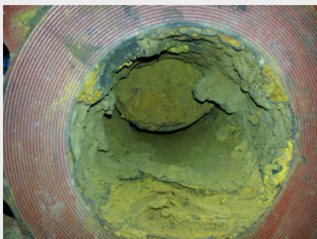
Bild 3: Weichdichtender Schieber, Bildnachweis: TU Berlin, FG Fluidsystemdynamik; DVGW-Forschungsprojekt W8/02/10 „Zustandsorientierte Instandhaltung erdverlegter Armaturen in der Wasserverteilung“; mit freundlicher Genehmigung

Auch eine Pilotstudie des Instituts für Grundwasserökologie an der Universität Koblenz-Landau aus dem Jahr 2012 mit dem Focus auf Wasserasseln hat eindrucksvoll gezeigt, welche positive Auswirkungen die Entfernung des Biofilms durch die Comprex-Reinigung hat [1]. So konnte in dem gereinigten Netzabschnitt des an der Studie beteiligten Wasserversorgers die Population der Tiere um fast 99 % vermindert werden. Die geringe Wiederbesiedelung zwei Monate nach der Reinigung weist außerdem darauf hin, dass durch die Reinigung den Tieren die Nahrungsgrundlage entzogen und damit die eigentliche Ursache des Befalls bekämpft wurde.