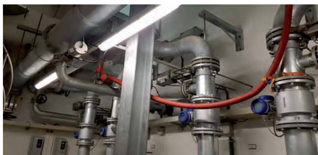
Abb. 5: Drucklufteinspeisung im Pumpwerk Küssnacht

Die losgelösten Ablagerungen wurden in den anschließenden Kanalabschnitt gespült und sollten mittels temporärer Rückhaltesperre zurückgehalten werden. Aufgrund der mit großer Geschwindigkeit auftreffenden Pakete aus Luft- und Wasserblöcken war dies nur mit mäßigem Erfolg möglich. Die Menge der durch die Spülung mobilisierten Ablagerungen dürfte um einiges größer sein als das abgesaugte Material. Nach jeder Etappe wurde der zur Ablagerung vorgesehene Kanalabschnitt vor der Rückhaltesperre mittels Saugwagen gereinigt. Insgesamt wurden knapp 3 t Ablagerungen abgesaugt und entsorgt