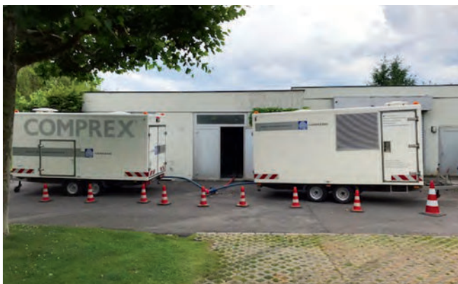
Abb. 3: Die Complex-Reinigung lässt sich auch bei eingeschränkten Platzverhältnissen durchführen.