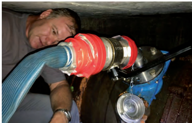
Abb. 4: Druckluftanschluss beim Zwischeneinspeisepunkt

Für die Spülung der Regenwetterleitung (RWL) wurde aufgrund der starken Ablagerungen und des größeren Durchmessers eine rückschreitende Spülung in zwei Etappen durchgeführt. Die erste Spül-Etappe erfolgte vom Zwischeneinspeisepunkt (Flansch auf G-Storz und Kugelhahnen, Abbildung 4) zum Übergabeschacht im Kanal. In der zweiten Etappe wurde die Spülung vom Pumpwerk (Abbildung 5) zum Übergabeschacht durchgeführt. Dadurch konnten mobilisierbare Ablagerungen ohne Gefahr einer Verstopfung aus der Leitung etappenweise ausgespült werden. Einen Überblick über die Daten der Reinigung gibt Tabelle 1.