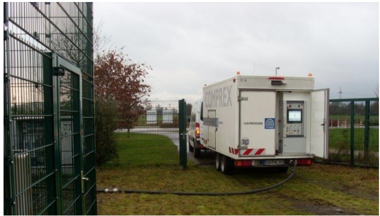
Abbildung 1: Comprex®-Einheit im Einsatz