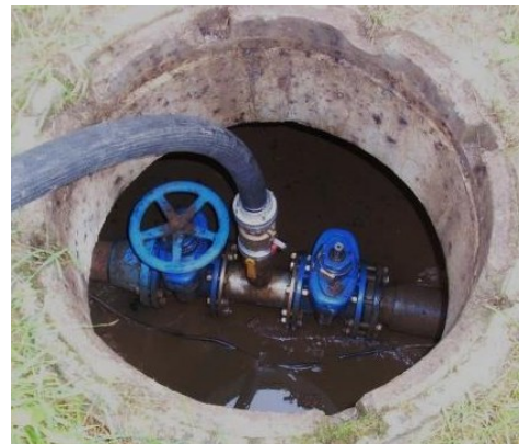
Abbildung 3: Einspeisung in Schacht über Adapter