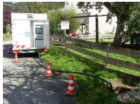
Abbildung 2: Einspeisung in Schacht