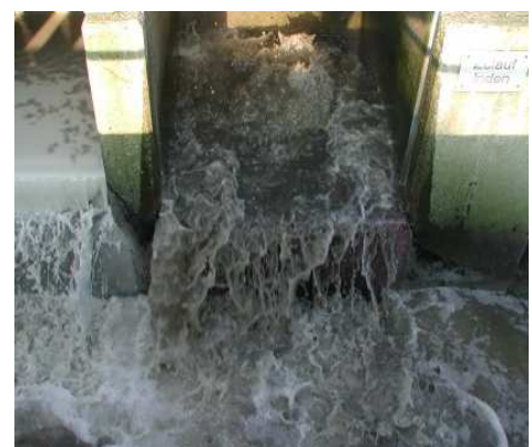
Abbildung 4: Ausspeisung am Klärwerk (Symbolfoto)