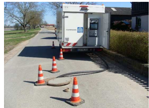
Abbildung 3: Einspeisung