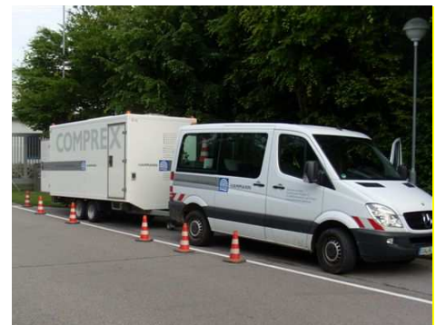
Abbildung 2: Comprex®-Einheit im Einsatz