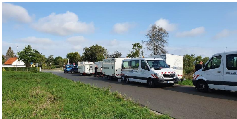
Abbildung 1: Comprex®-Einheiten im Einsatz vor Ort

Referenzprojekt Abwasserdruckleitung Klärwerk Cuxhaven