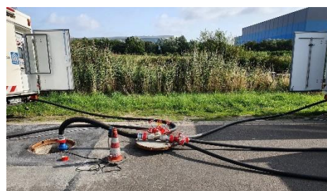
Abbildung 2: Synchronisation der Comprex®-Einheiten an Einspeisestelle