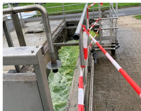
Abbildung 3: Ausspeisestelle der Spülstrecke