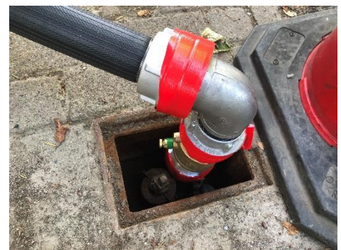
Abbildung 3: Zugang über Adapteranschlüsse