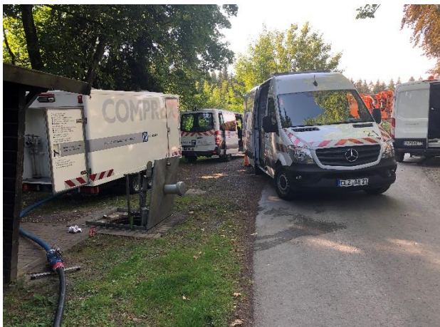
Abbildung 6: Situation vor Ort