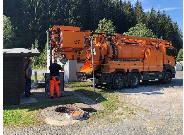
Abbildung 7: Saugfahrzeug vor Ort