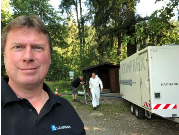
Abbildung 4: Im Einsatz vor Ort