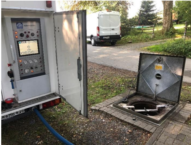
Abbildung 5: Complex-Einheit vor Ort