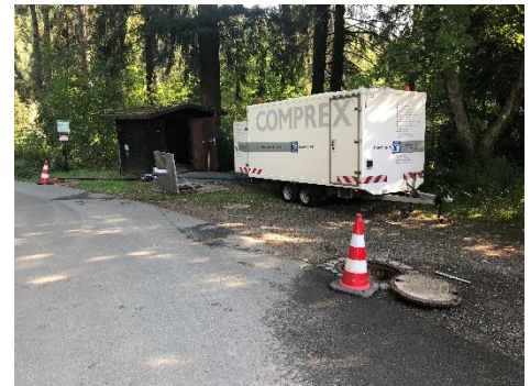
Abbildung 2: Comprex®-Einheit im Einsatz