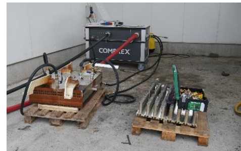
Abbildung 2: Kühlstation und Entnahmeplatte mit mobiler Comprex® Einheit im Hintergrund