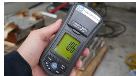
Abbildung 3: Trübungsmessung als begleitende Qualitätskontrolle