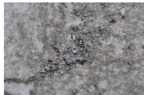
Abbildung 4: Schmutzaustrag aus Spritzgießwerkzeugen