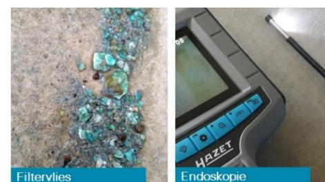
Abb. 4: Schmutzaustrag / Endoskop