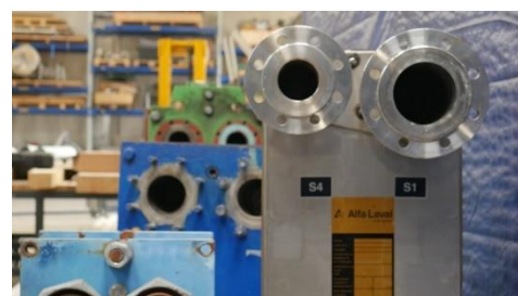
Abb. 3: größere Wärmeübertrager