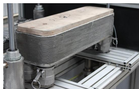
Abb. 2: eingespannter Wärmeübertrager

https://comprex.de/reinigungszentrum-landau/