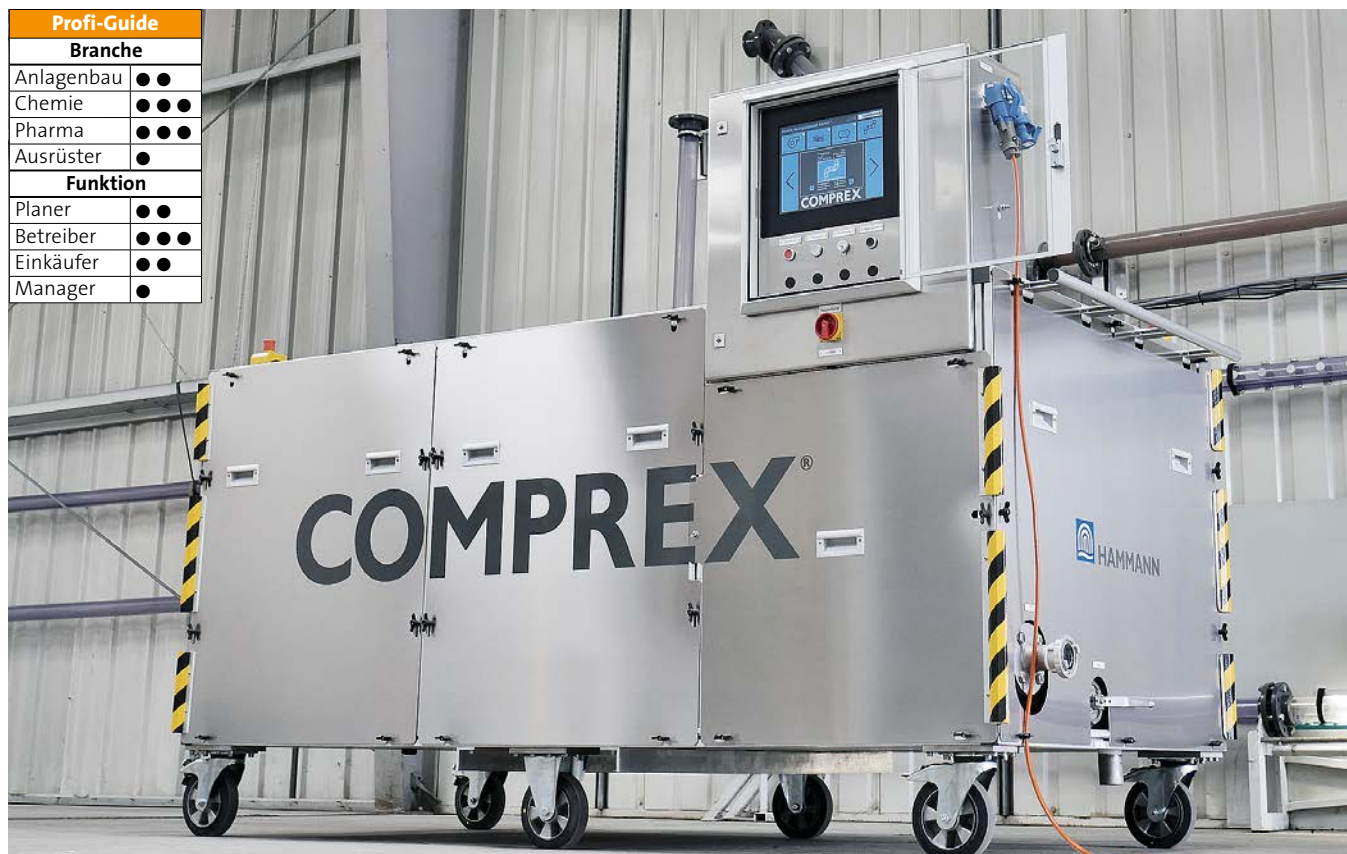
Prototyp der mobilen Complex-Unit zur Rohrreinigung