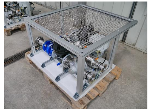
Abbildung 2: SCU als Wandmodul im Einbauzustand mit Schutzgitter