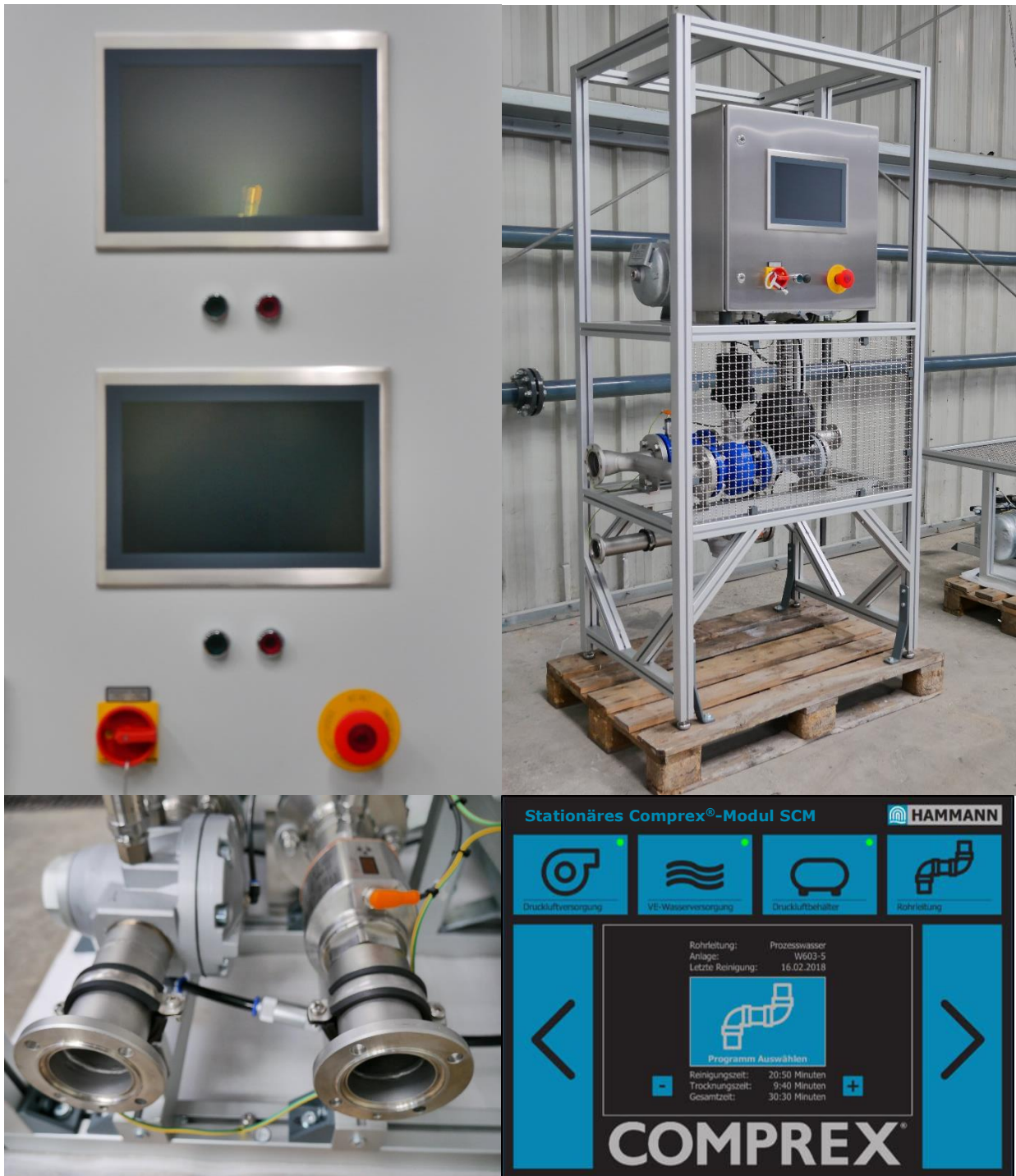
Abbildung 5: Weitere Ansichten der SCU (links oben: Kombi-Schaltschrank zur Steuerung von zwei Wandmodulen; rechts oben: Stand-Alone Ausführung; links unten: Flanschanschlüsse; rechts unten: Beispiel für Comprex-Software)