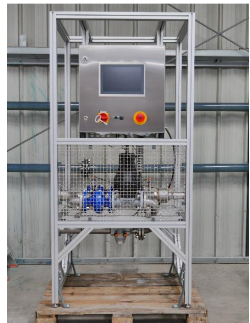
Abbildung 3: Stand-Alone-Version der SCU